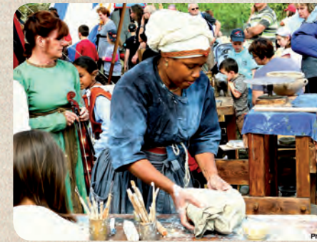
Déroulement à titre indicatif, susceptible de subir de légères modifications