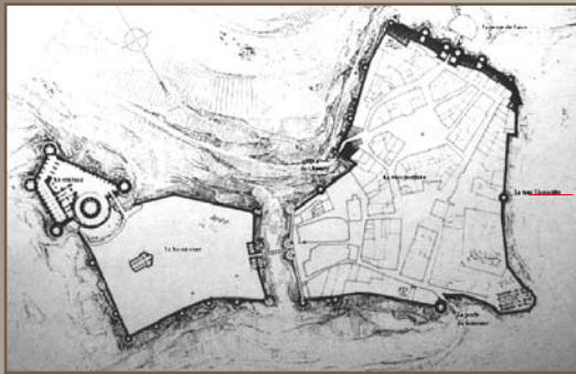
LE SITE FORTIFIÉ DE COUCY

La tour Lhermitte fait partie de l'ensemble fortifié de Coucy-le-Château, vaste forteresse du XIII e siècle ceinte de remparts et de tours de garde. Bâtie après 1225, elle a les attributs d'une tour maîtresse. Sa position et son diamètre particulièrement important en font un point de commandement stratégique couvrant tout le flanc Est du site.