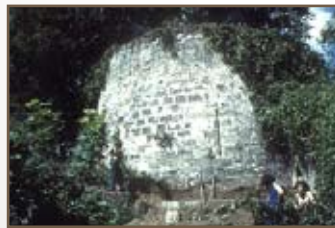
LA TOUR LHERMITTE EN 1980

C'est en 1981 que l'Association de Mise en Valeur du Château de Coucy s'intéresse à cette construction devenue très dangereuse et envisage une restauration partielle dans le cadre de chantiers de jeunes bénévoles. Les travaux s'échelonnent entre 1981 et 1992 puis entre 1997 et 2007, redonnant peu à peu à la tour son aspect et son sens d'origine. L'intérieur est dévégétalisé puis vidé de sa terre, les maçonneries sont traitées (dégagement du ciment, rejointoiement, les pierres abîmées sont remplacées), des éléments importants pour la lecture de l'édifice sont restitués.