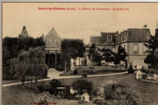
LE JARDIN DU DOMAINE DU GOUVERNEUR

Malgré la mise à mal du site lors de la Grande Guerre, les restes de la tour sont épargnés. La propriété du Gouverneur Lhermitte, dont ils font partie, est alors léguée à la commune de Coucy à la condition d'en faire un parc municipal.