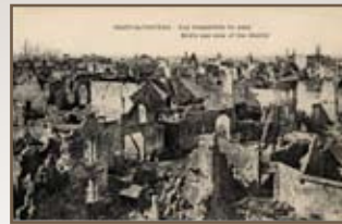
COUCY APRÈS LES DESTRUCTIONS DE 1917

Malgré la mise à mal du site lors de la Grande Guerre, les restes de la tour sont épargnés. La propriété du Gouverneur Lhermitte, dont ils font partie, est alors léguée à la commune de Coucy à la condition d'en faire un parc municipal.