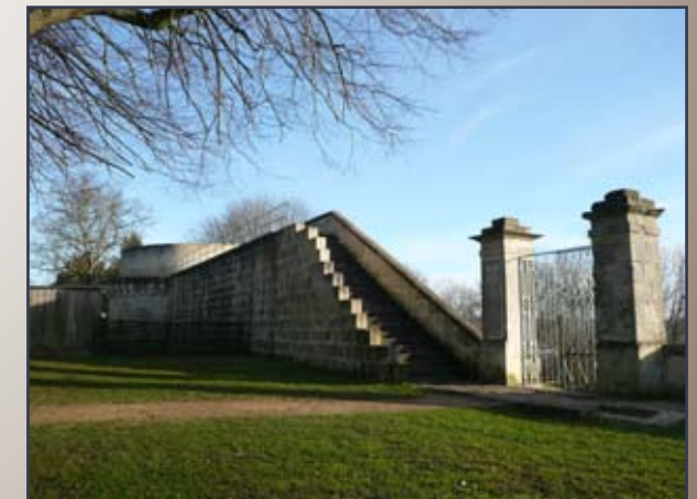
LE PORTAIL, LA COURTINE ET LA TOUR LHERMITTE